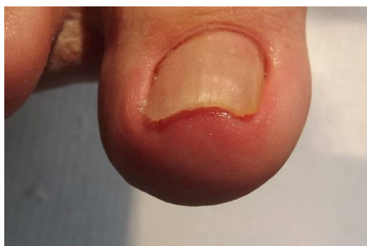
Ná de behandeling