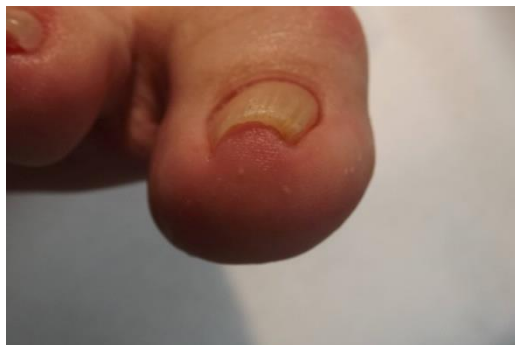
Vóór de behandeling